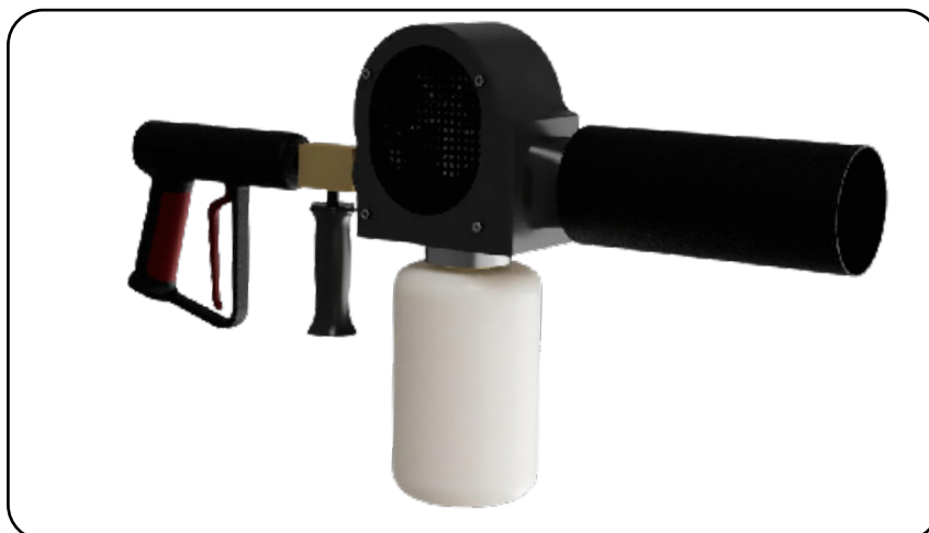
FoamGiant Plus für Löschanlagen ohne eingebauten Schaummittelzumischer